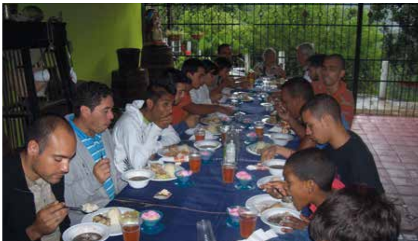
Salón comedor de jóvenes

Y ya en el año 2000 acontece la fundación del Centro de Crecimiento integral Fray Luis Amigó y se inicia la Comunidad Terapéutica Ambulatoria.