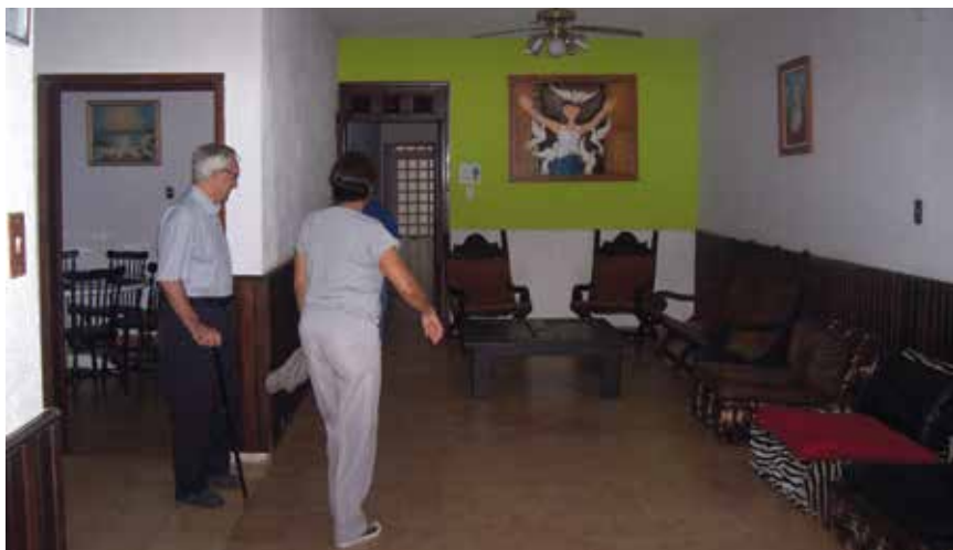
Hall del Centro