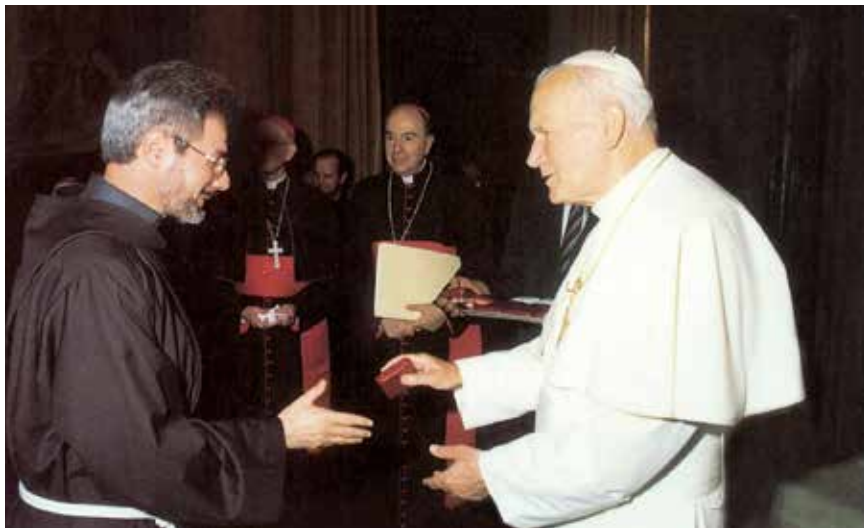
Postulador General OFM cap y Su Santidad Juan Pablo II

Tampoco podemos silenciar el juicio de uno de los Relatores sobre Luis Amigó y Ferrer y que recoge textualmente así mismo el Decreto de Venerable : “Que estamos ante un gigante de la vida espiritual, modelo y prototipo de religiosos, sacerdotes, obispos y fundadores”.