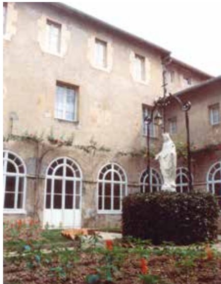
Convento capuchino de Bayona (Francia)

Pronto por la provincia se va corriendo la fama