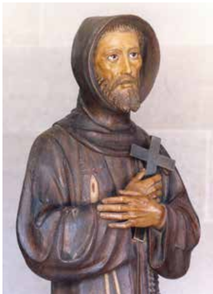
Seráfico Padre San Francisco

Por esto siempre procuré que siguiesen la pobreza y humildad de Nuestro Señor Jesucristo. Que entre ellos no hubiese clases, sino fraternidad. Que nadie deseara ser mayor, sino todos menores, sencillos, apacibles, modestos, humildes y fraternos. Que entre ellos el que mandase fuese el menor, ministro y servidor de sus hermanos. Pues que así debe ser: que el ministro sea el servidor de sus hermanos, y que el que manda sea como el que sirve. Y con el nombre de ministros designé a los primeros superiores del instituto.