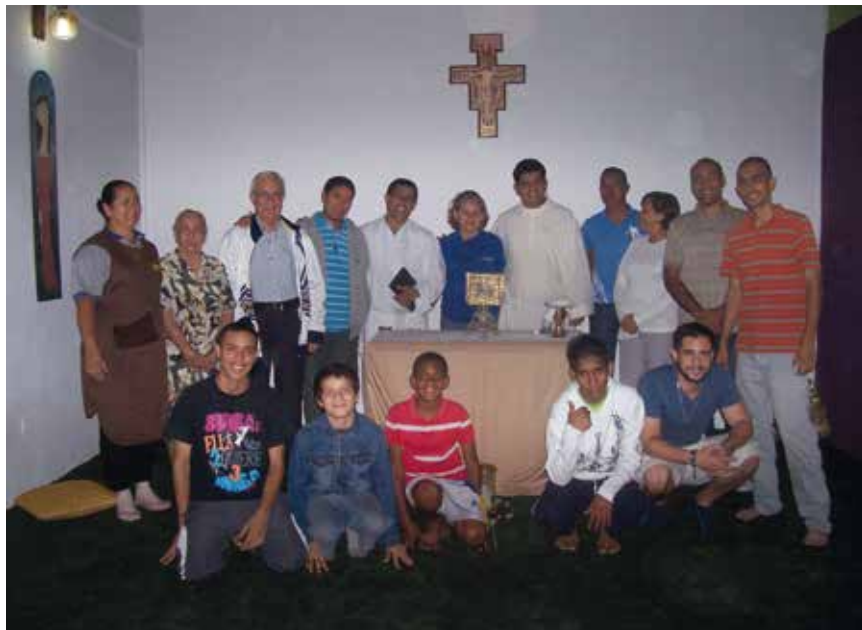
Asistentes a la Eucaristía

Programa Amigó, ubicado en la llamada finca Amigó, y que es al que nos referimos, destinado a preadolescentes, adolescentes y jóvenes internos, varones de 15 a 25 años. Y el Programa Fray, centro abierto en la ciudad de La Victoria, y en el que se atendían semanalmente de 80 a 100 personas en la doble etapa de adolescentes y adultos.