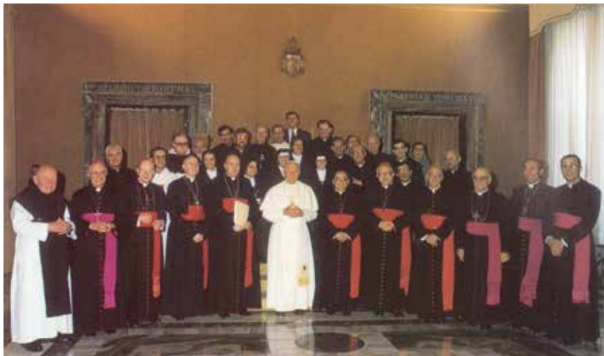
Luis Amigó proclamado Venerable

XXV ANIVERSARIO DE LA DECLARACIÓN DE VENERABLE