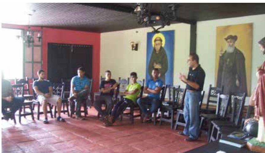
Jóvenes internos con educador