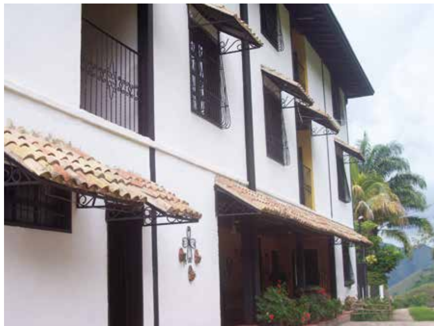
Fachada del Centro Fr. Luis Amigó