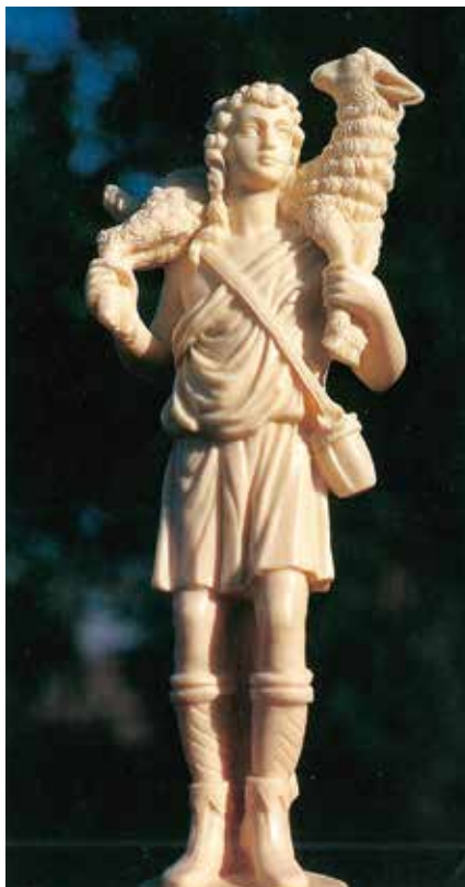
Cristo Buen Pastor

Es posible que al llegar a este punto, si has tenido la paciencia de seguirme atentamente, me taches de idealista. De iluso tal vez. Tal vez incluso, de soñador. Pero bien sabe Dios que yo no fui hecho para elu-