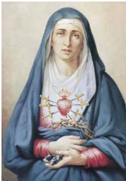
Virgen de los Dolores.

go yo deseaba la fraternidad de mis hijos, tanto como Francisco pudo desear la de los Menores, a quienes reunía en la Porciúncula una vez al año para tratar de las cosas que cumplen al servicio de Dios. Y para ver, al amparo de la Señora, el mejor modo posible de observar la Regla.