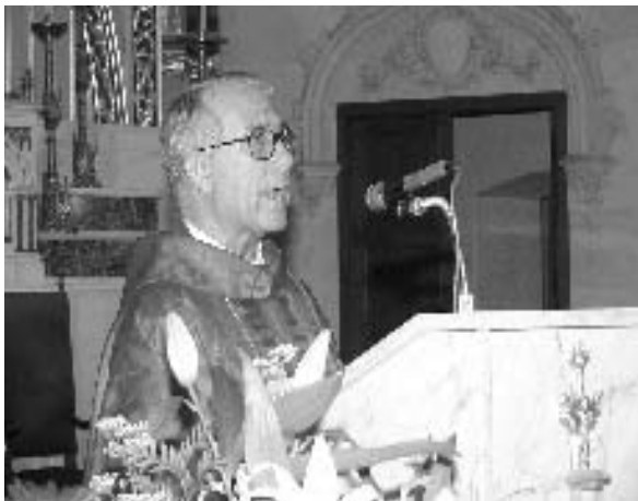
El Rmo. P. General pronunciando la homilía.

dotes, como indica la adjunta información gráfica. Toma parte en la celebración un número elevado de religiosos y religiosas terciarios capuchinos, miembros de la familia franciscana y de otras congregaciones religiosas, y una muy numerosa representación de familiares de los mártires, conocidos y amigos.