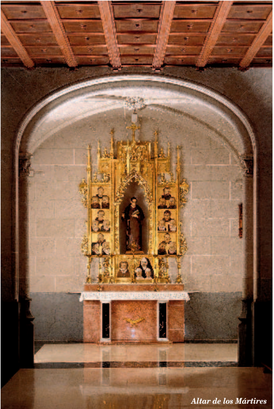
Altar de los Mártires