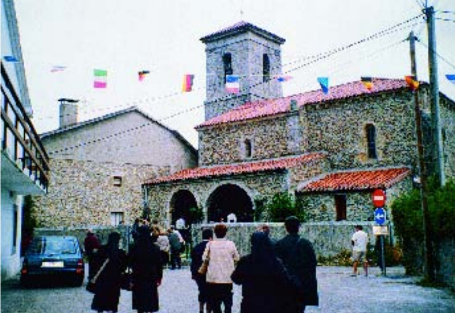
s Los peregrinos se dirigen a la parroquia de Soano Interior de la parroquia de Soano t