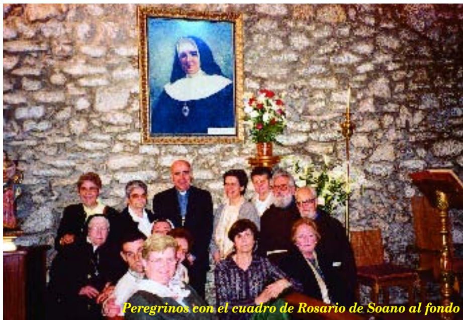
Peregrinos con el cuadro de Rosario de Soano al fondo