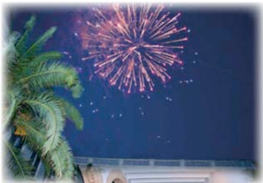
▲ Fuegos artificiales Vino español ►