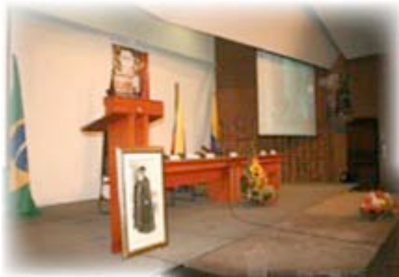
◀ Estrado de los conferenciantes