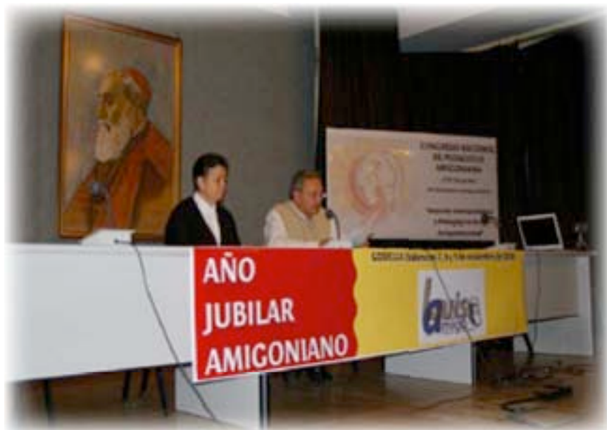
▲ Apertura del Congreso

La organización ha querido unificar el Congreso Nacional de Pedagogía con el XVII Encuentro de Educadores Amigonianos que anualmente se viene teniendo por las mismas fechas y con objetivos parecidos o similares.