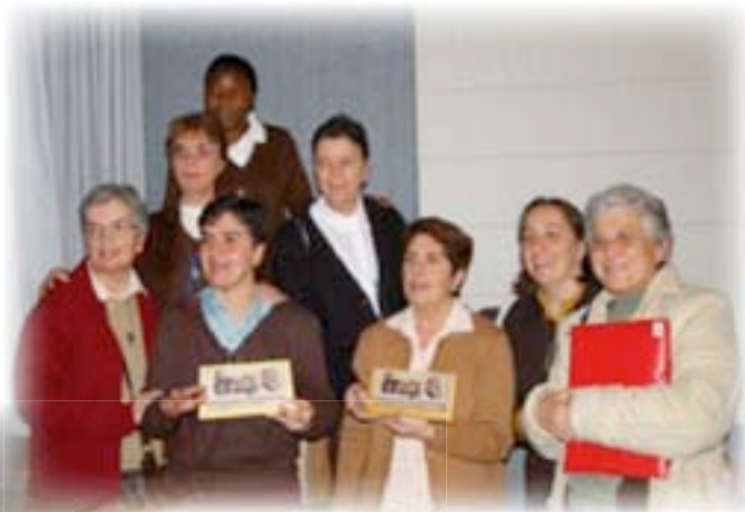
▲ Grupo de hermanas congresistas