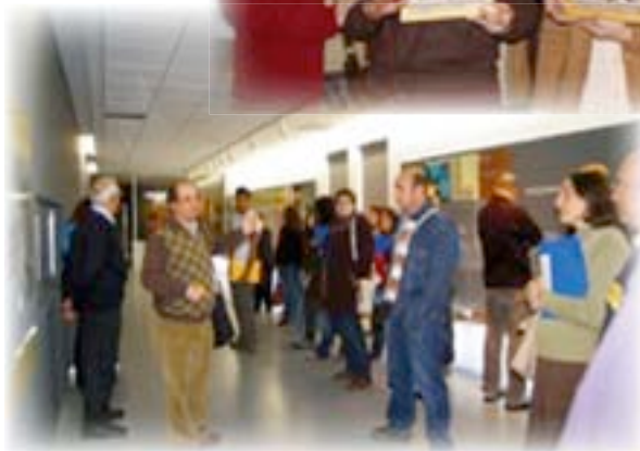
◀ Visita guiada al Museo Pedagógico

La finalidad del Congreso Nacional de Pedagogía Amigoniana , a más de honrar al Venerable P. Luis Amigó en el 75 aniversario de su muerte, ha sido la de reflexionar, por medio de ponencias y nuevas experiencias con diversos modelos de intervención, sobre el trabajo que desarrolla la Familia Amigoniana con la infancia y juventud desviadas del camino de la verdad y del bien.