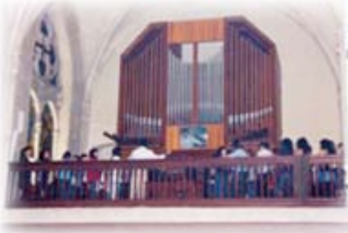
▲ Coro amigoniano