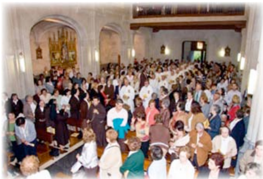
▲ Procesión de entrada

En las 33 naciones que cuentan con presencia de la Familia Amigoniana, durante el mes de octubre pasado, se ha tenido con cierta solemnidad la Apertura del Año Jubilar Amigoniano . Y ha gozado de una especial solemnidad en Santafé de Bogotá y en Medellín, Colombia, por la numerosa asistencia. Pero el acto de la Apertura del Año Jubilar ha gozado de una especial solemnidad en el Seminario de San José de Godella (Valencia), España, por ser el convento en el que el Venerable Padre Luis Amigó pasó los últimos días de su existencia terrenal y entregó su espíritu al Señor.