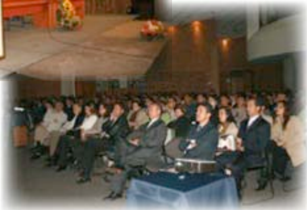
Salón de conferencias ▶

El propósito del congreso -a más de honrar al Venerable P. Luis Amigó en el 75 Aniversario de su Muerte- ha sido el de abrir un espacio de reflexión, socialización y discusión alrededor de las prácticas amigonianas, sus saberes, estrategias y alternativas de intervención en el campo social.