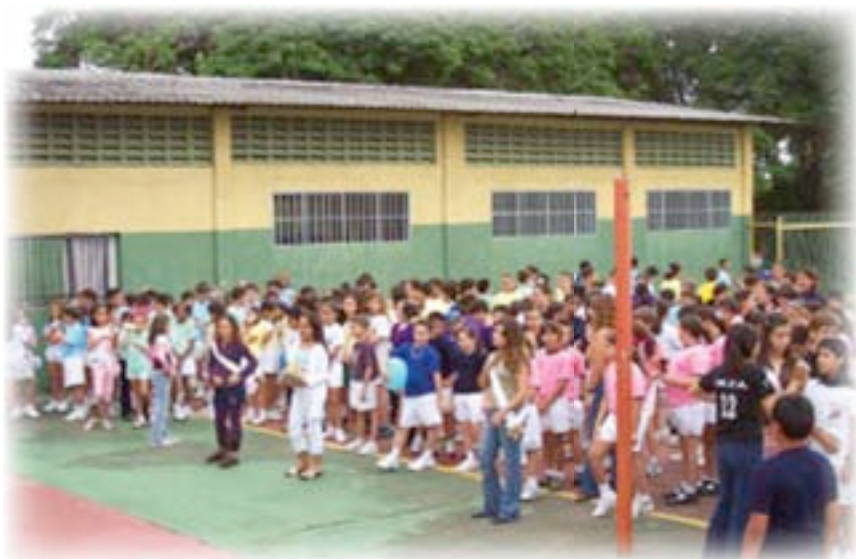
▲ Grupito de estudiantes

El Rmo. Superior General, P. Ignacio Calle Ramírez, presidió las celebraciones del cincuentenario, entre ellas la santa misa de acción de gracias, concelebrada por varios sacerdotes, la asistencia de las autoridades de la ciudad y numeroso público, en general amigos del centro.