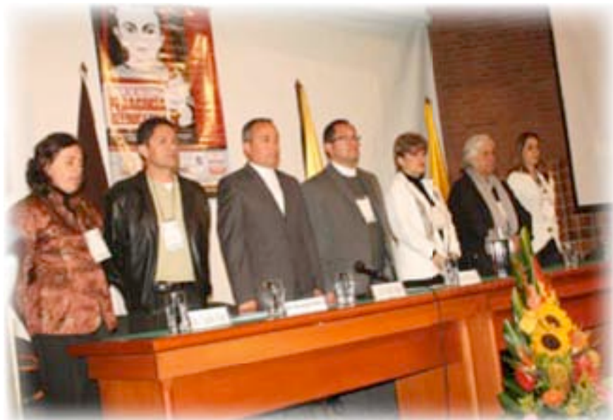
▲ Presidencia del Congreso

Colombia: Congreso Nacional de Pedagogía Reeducativa