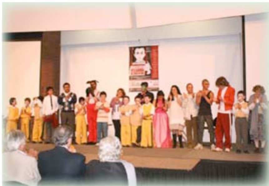
▲ Alumnos del colegio Espíritu Santo