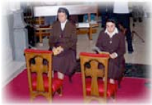
▲ Hnas. Superiores Provinciales

En la acción eucarística la parte musical corrió a cargo del Coro de las Escuelas Profesionales Luis Amigó de Godella (EPLA), Valencia, y del Coro de Jóvenes Laicos Amigonianos, junto con el coro parroquial de Serra, también de Valencia. Su actuación fue muy apreciada.