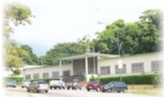
▲ Fachada del colegio Fr. Luis Amigó

A la misa de acción de gracias siguió un acto patriótico al Libertador Simón Bolívar en la Plaza Mayor de San Felipe y en el que participaron, obviamente, el Sr. Alcalde y autoridades de la ciudad, numeroso público y amigos del Colegio.