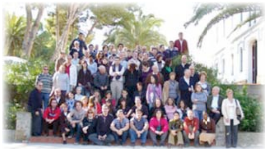
▲ Grupo de congresistas