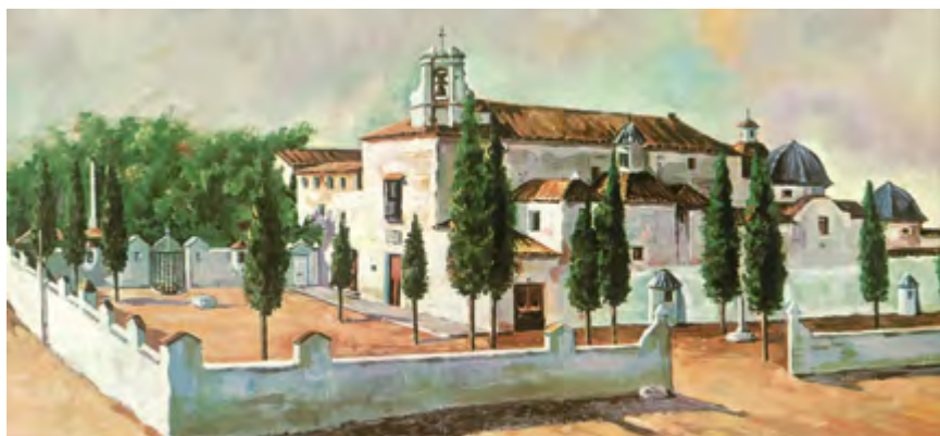
Convento alcantarino de Torrent, Valencia.

De su recta intención habla bien a las claras el hecho de haber sido llamado por los superiores mayores para predicar en Monte Sión el primer día de acción de gracias por la aprobación pontificia de la congregación amigoniana el año 1902.