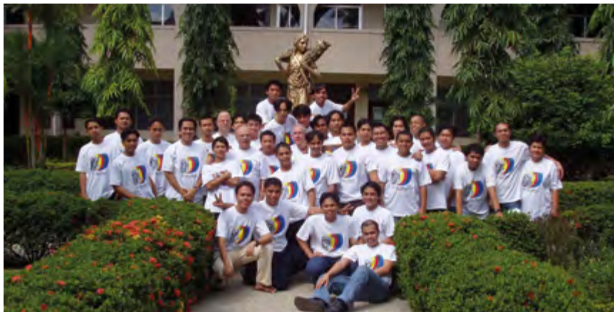
Residentes en la Casa de Formación.