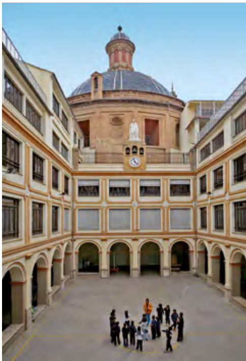
Escuelas Pías de Valencia.

Desde niño el Señor le dio inclinación al sacerdocio. Siempre tuvo pocos amigos y procuraba fueran de más edad que él, e inclinados a la piedad. En estos años de que tratamos disfrutaba de la amistad de sus cuatro amigos, pues dice que en aquel tiempo tenía cuatro amigos y todos aspirábamos a entrar