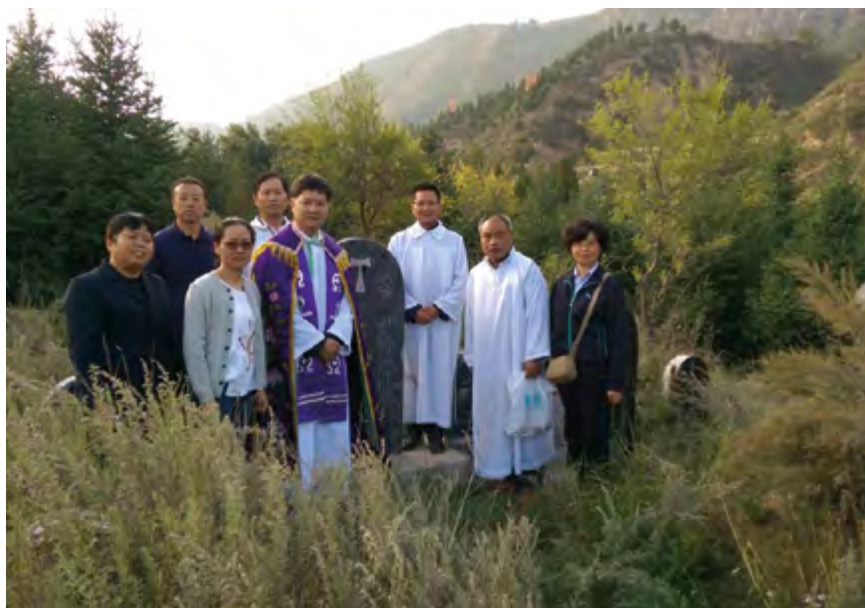
China. Hermanas Terciarias Capuchinas.