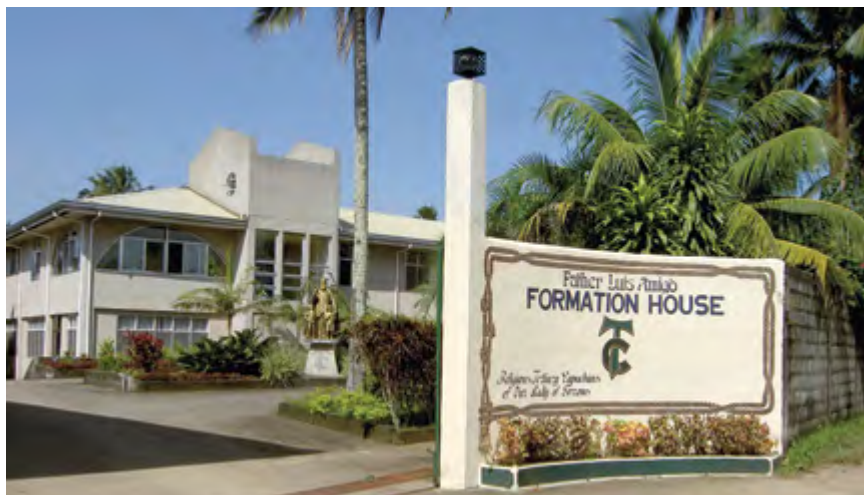
Padre Luis Amigó. Centro de Formación.