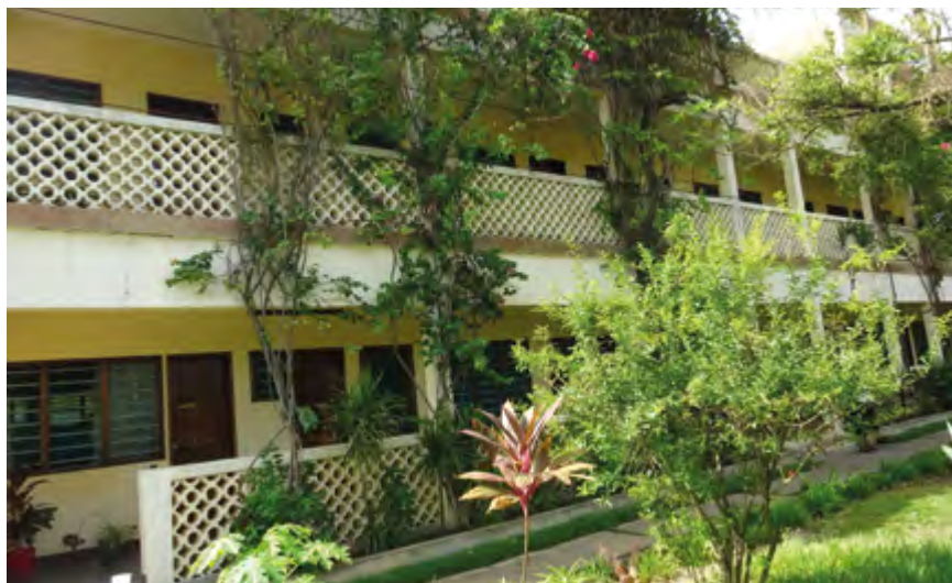
Benín. Cotonou. Institución Fray Luis Amigó.