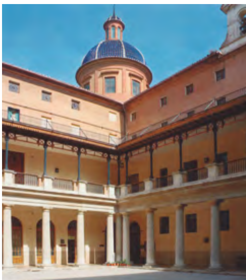
Seminario Conciliar de Valencia.