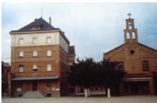
Colegio de Santa Rita, Madrid.