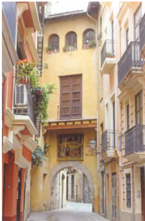
Portal de Valldigna, Valencia.

Es un hecho que el hombre madura en la vida a fuerza de golpes de sacrificio y bajo la inmensa piedad de Dios. Así va encontrando su puesto en la vida y va madurando y desarrollando su propia vocación.