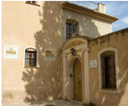
Convento de la Magdalena

Llevaba ya varios días el limosnero en descanso pues la lluvia tan intensa tenía todo embarrado y no se podía estar por las calles limosnando . Y el que vive de limosnas vive de lo que le han dado, y si no tiene con qué, le rondarán los milagros si tuviera algo de fe, porque si no..., va apañado.